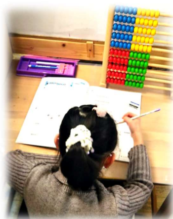
安心できるもう一つの子供部屋です。