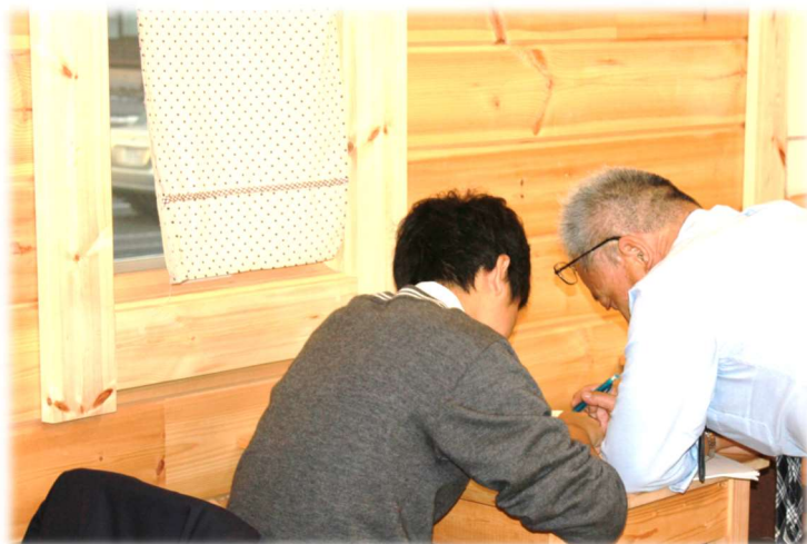
個別対応塾 Orbit の教室は