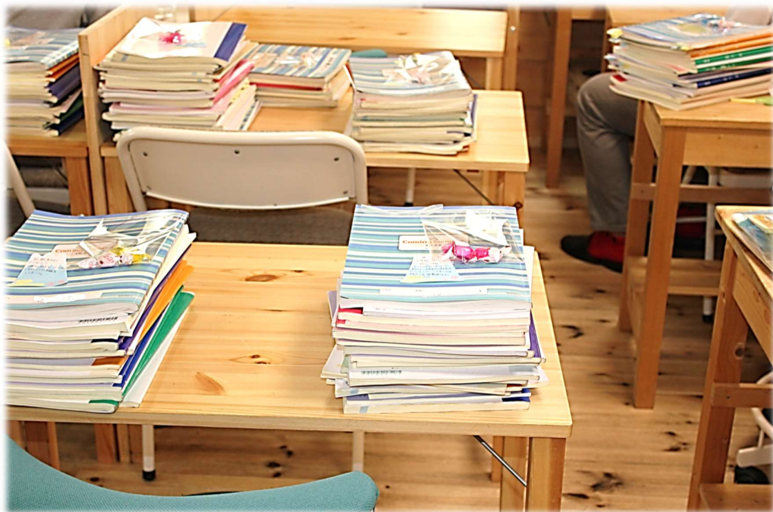
模試の日の恒例、小・中学生テキスト点検。常にトータルでの成長をサポート。