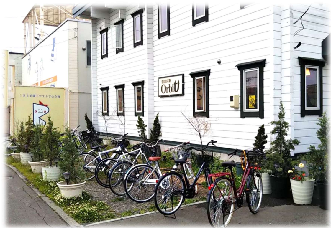
安心安全の教育環境。