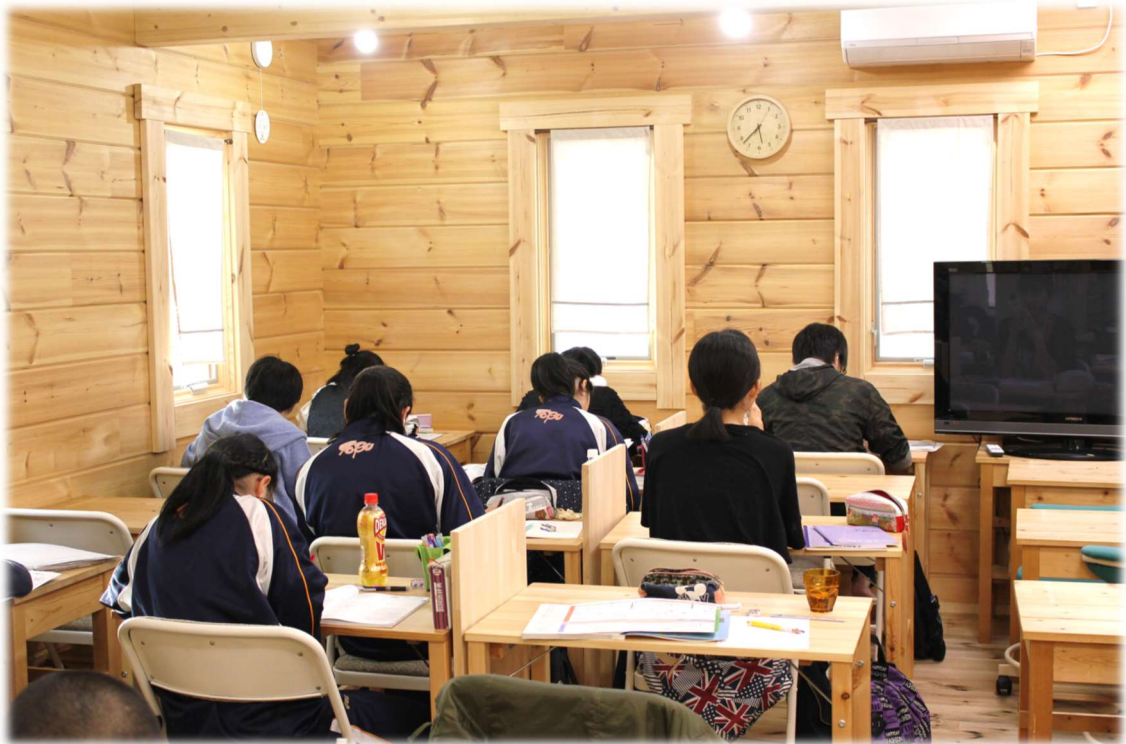
明るく、木の香り漂う自習室。