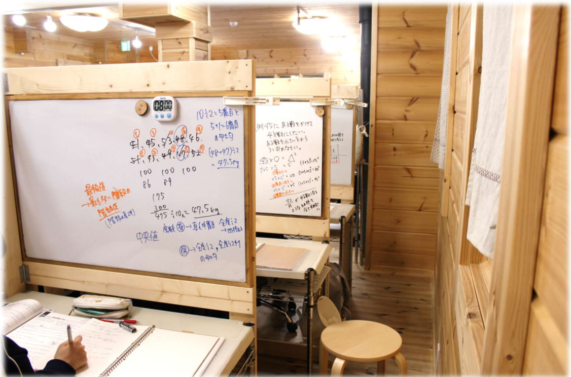
個別に仕切られた授業席。自分専用の板書で分からないところもスッキリ解決。